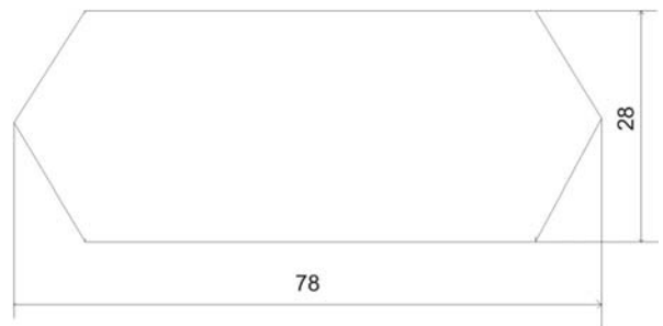
Indicator de direcție dublă