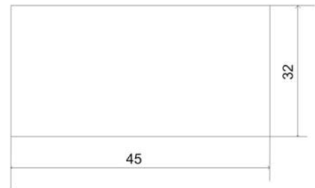
Indicator de traseu cu dimensiuni variabile 32/45 40/56 50/70 63/87